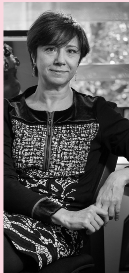
Núria Sebastián Gallés

La barcelonesa Núria Sebastián Gallés es en una de las figuras más relevantes a nivel internacional en el campo del estudio de la adquisición y el procesamiento del lenguaje. En concreto, se la considera uno de los referentes en el estudio del aprendizaje del lenguaje en bebés expuestos a entornos bilingües. Ha recibido numerosas distinciones, tanto a nivel nacional, como internacional. Entre ellas cabe destacar, la Vice-presidencia del European Research Council (ERC) en los años 2014, 2015 y 2016. En 2016 fue elegida miembro de la British Academy (corresponding fellow). En 2012 recibió la Medalla Narcís Monturiol otorgada por la Generalitat de Catalunya. En 2001 obtuvo un premio de la Fundación S. McDonnell dentro del programa Bridging Mind, Brain and Behaviour. En 2005 impartió una de las prestigiosas Nijmegen Conferences con el título Babel, conferencias organizadas conjuntamente con la universidad de Nijmegen y el Instituto Max Plank. Entre 2002 y 2006 fue miembro del grupo asesor de la iniciativa Cerebro y Aprendizaje de la OCDE. En 2009, 2014 y 2019 recibió el premio de la Academia ICREA. Ha sido Presidenta de la Sociedad Europea de Psicología Cognitiva y Vice-presidenta de la Sociedad Española de Psicología Experimental.