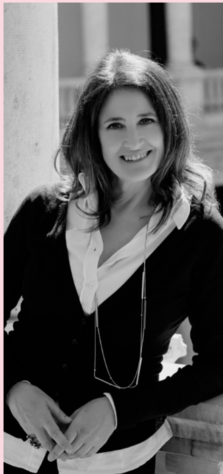
Sacramento Pinazo Hernandis